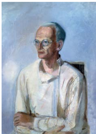
Alexander A. Labas: Bildnis Heinrich Vogeler – Ölbild, 1935