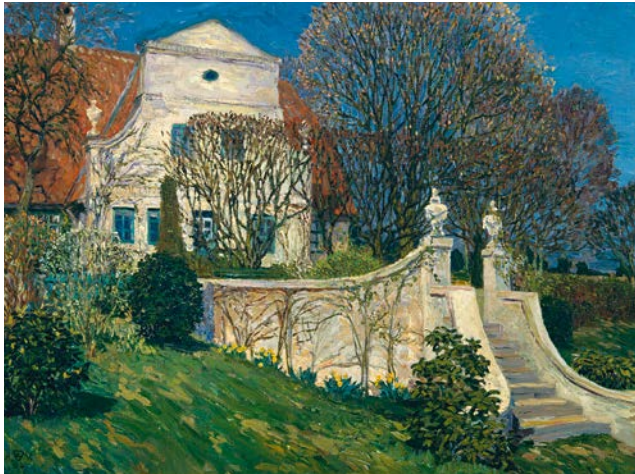
Der Barkenhoff, 1904, Ölbild

Heinrich Vogeler – ein deutsches Schicksal, das mit einer wohlbehüteten Kindheit vor 150 Jahren begann und 1942 in einem Kolchos bei Kornejewka in Kasachstan ein tragisches Ende fand. Der gebürtige Bremer war Maler, Grafiker, Architekt, Designer, Pädagoge und Schriftsteller. In jungen Jahren zieht es ihn nach Wörpswede, wo er im „Barkenhoff“ residiert und der Jugendstilbewegung eindrucksvolle Beiträge schenkt. Sein Leben inszeniert er als Kunstwerk, gilt dem Bürgertum als „liebstes Kind“. Doch sein Traum, Kunst und Leben in Einklang zu bringen, erweist sich als brüchig. Privat und künstlerisch gerät er nach 1900 zunehmend in eine Krise. Im August 1914 folgt er freiwillig dem „Ruf der Waffen“. Doch die Grausamkeit des Völkermordens erschüttert ihn, und in einem christlich-ethischen Appell fordert Vogeler den deutschen Kaiser Wilhelm II. im Januar 1918 auf, den Krieg zu beenden – und landet für einige Wochen in einer Irrenanstalt. Fortan engagiert er sich für eine Welt, die auf Frieden, Freiheit und sozialer Gerechtigkeit beruhen soll, wird verleumdet und verfolgt. 1919 gründet er auf dem „Barkenhoff“ in Wörpswede eine Kommune und Arbeitsschule, aber das Experiment scheitert. 1924 übergibt er das Haus der „Roten Hilfe“, die darin ein Heim für Kriegswaisen und für Kinder einrichtet, deren Eltern aus politischen Gründen in Haft geraten sind.